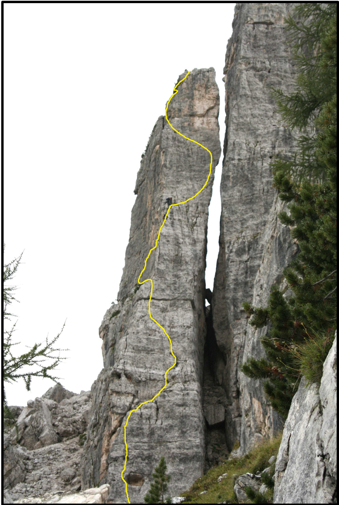
Torre Lusy - Via normale